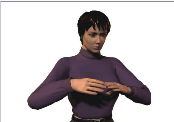
Optimale werkhoogte voor knippen: tussen borst en schouderhoogte

De kapper verricht bij het werken aan de pompstoel de vaktechnische handelingen tussen borst en schouderhoogte met de schouders én ellebogen ontspannen laag hangend. Bij uitzondering mag de kapper hoger (tot ooghoogte) knippen.