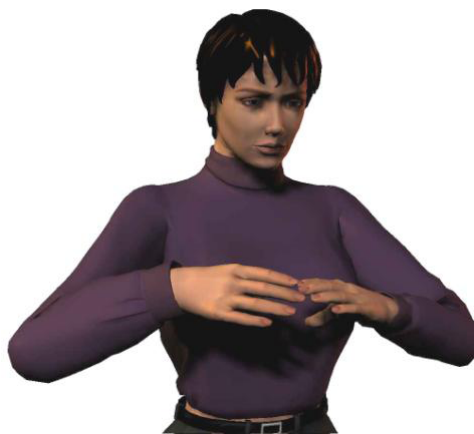
Optimale werkhogte voor knippen: tussen borst en schouderhoogte

De kapper verricht bij het werken aan de pompstoel de vaktechnische handelingen tussen borst en schouderhoogte met de schouders én ellebogen ontspannen laag hangend. Bij uitzondering mag de kapper hoger (tot ooghoogte) knippen.